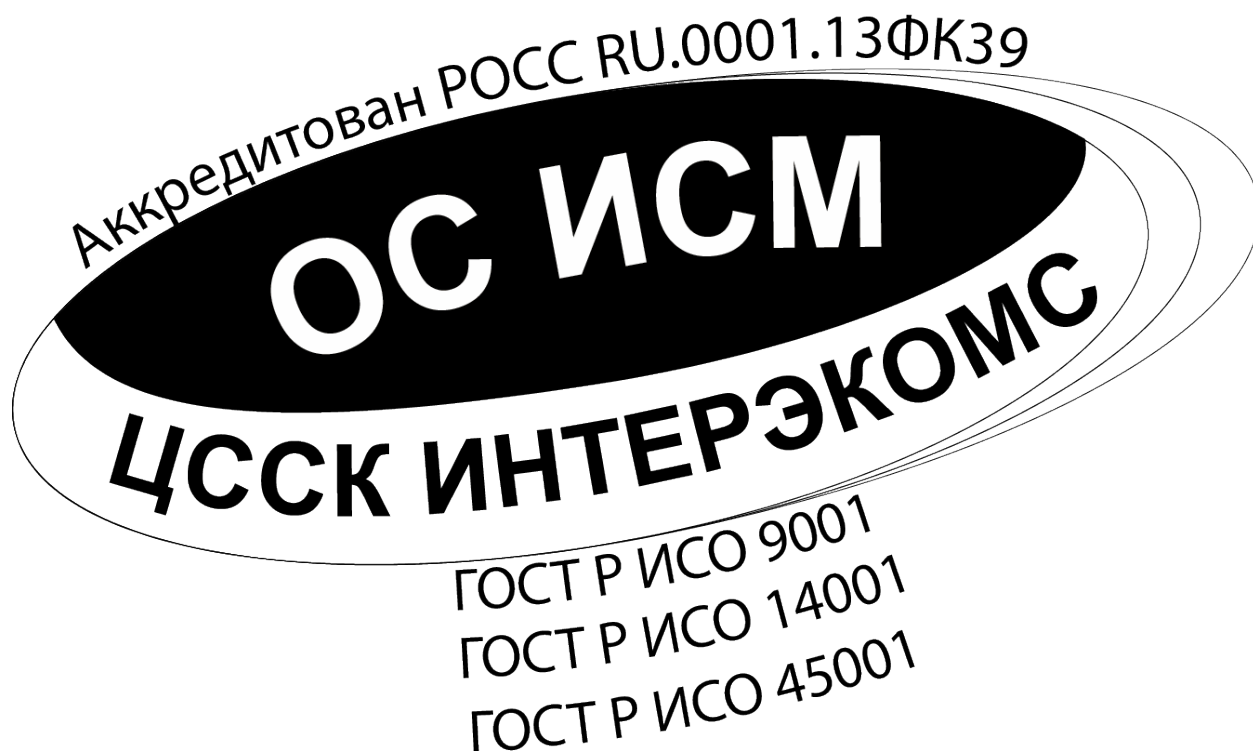
Изображение Знака соответствия ИСМ (СМК+СЭМ+СМБТиОЗ), сертифицированной ОС ИСМ

Размеры знака соответствия не менее 40 мм по каждой стороне