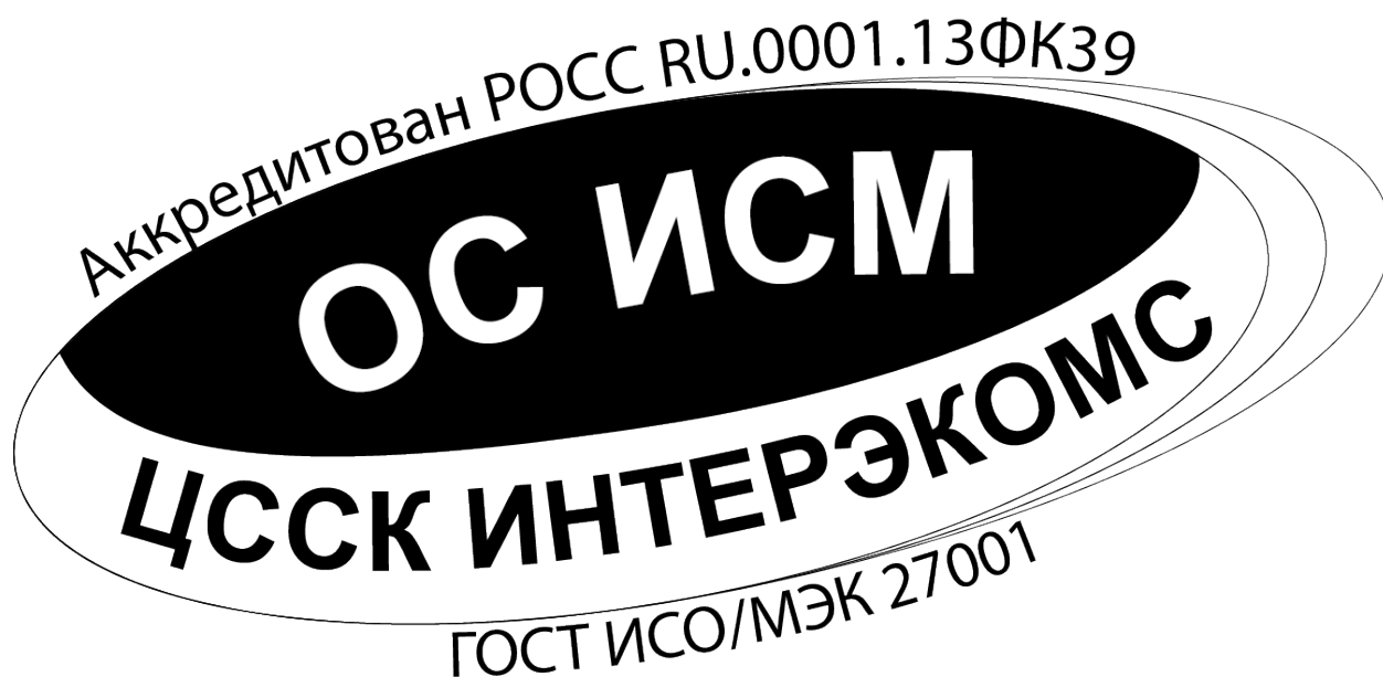
Изображение Знака соответствия СМИБ, сертифицированной ОС ИСМ.