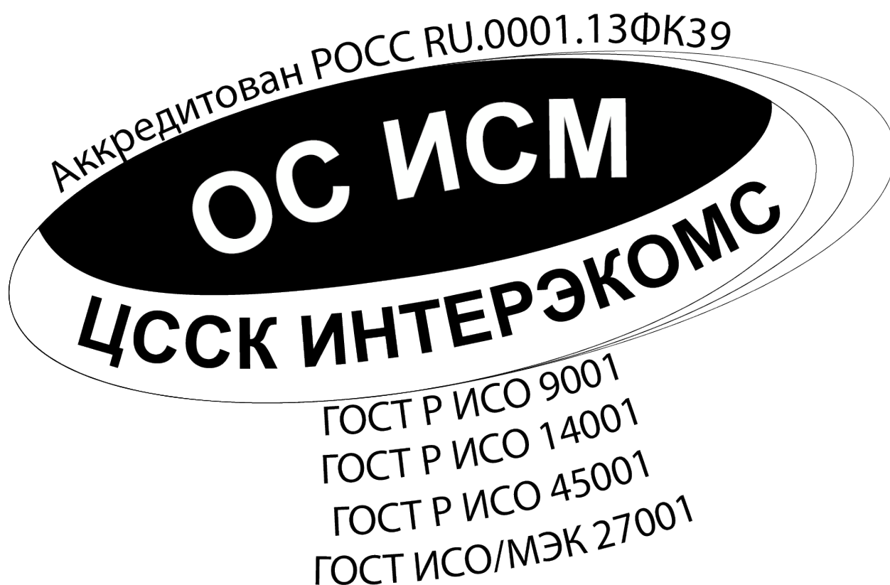
Изображение Знака соответствия СМК+СЭМ+СМБТиОЗ + СМИБ