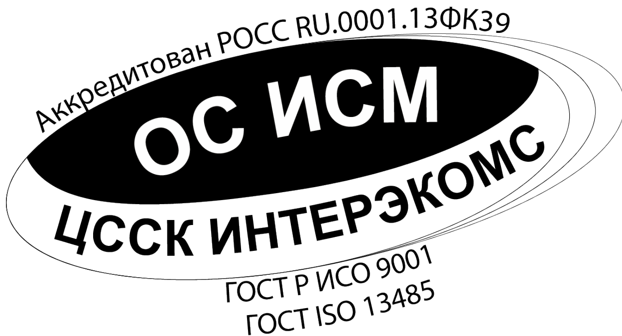
Изображение Знака соответствия СМК + СМК МП, сертифицированных ОС ИСМ.