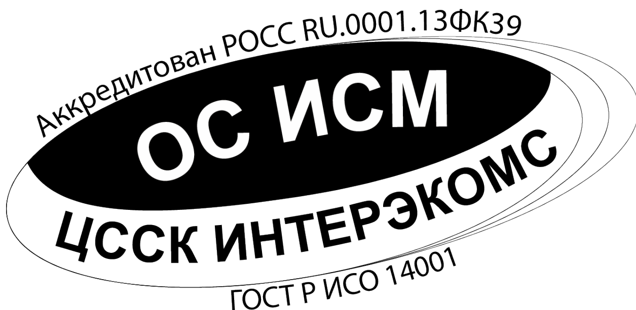
Изображение Знака соответствия СЭМ, сертифицированной ОС ИСМ.