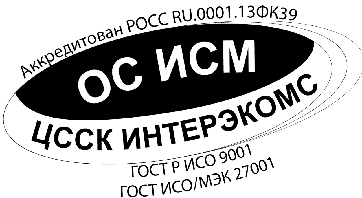
Изображение Знака соответствия СМК + СМИБ, сертифицированных ОС ИСМ.