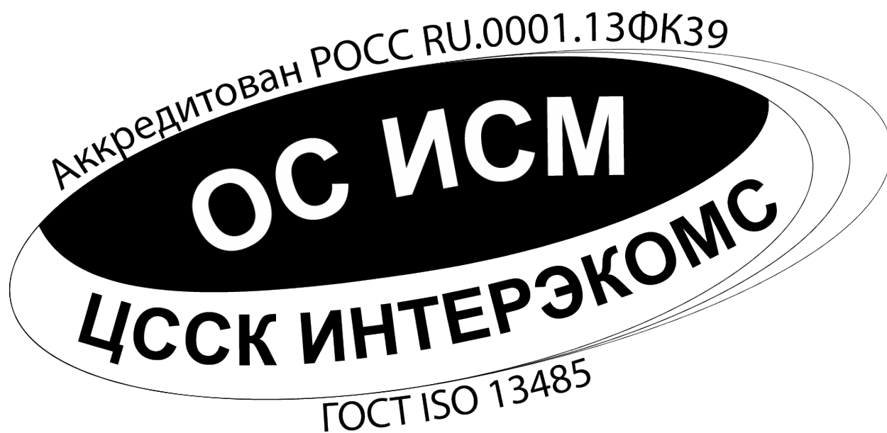
Изображение Знака соответствия СМК МП, сертифицированной ОС ИСМ.